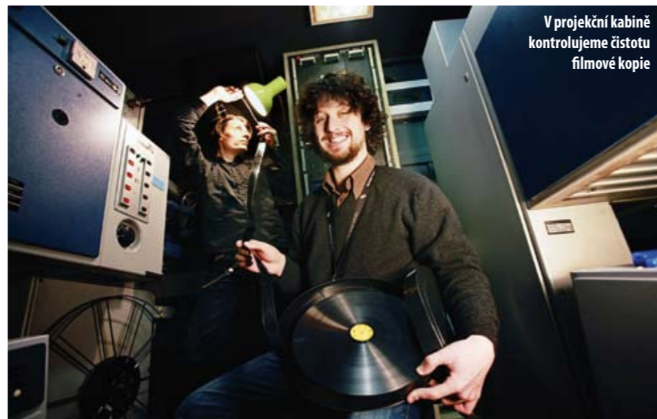
V projekční kabině kontrolujeme čistotu filmové kopie

tří na titulky. Přitom se dají přečíst, i když jsou trochu jeté, zato obraz by měl být ostrý.“ Bývalý promítač je na druhou stranu smířený s multiplexovou neostrostí: „Je to spíš atrakce než prostor pro promítání. Divák má ohromit, že kouká na velký obraz, což je nesmysl, vždyť když není schopný očima to plátno pojmout, protože je moc velký, nic z toho nemá.“ Velmi dobře to vědí v berlínských multiplexech, kde se za místa ve vzdálenější polovině sálu vybírá příplatek.