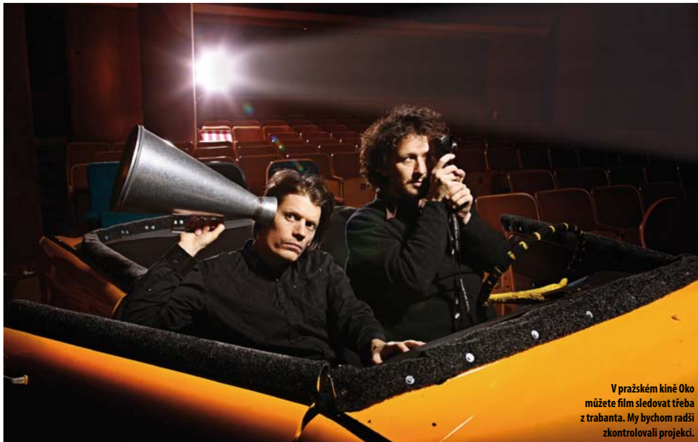
V pražském kině Oko můžete film sledovat třeba z trabanta. My bychom radši zkontrolovali projekci.